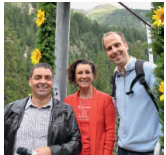
Maria Walliser war als Botschafterin von SOS-Kinderdorf dabei.