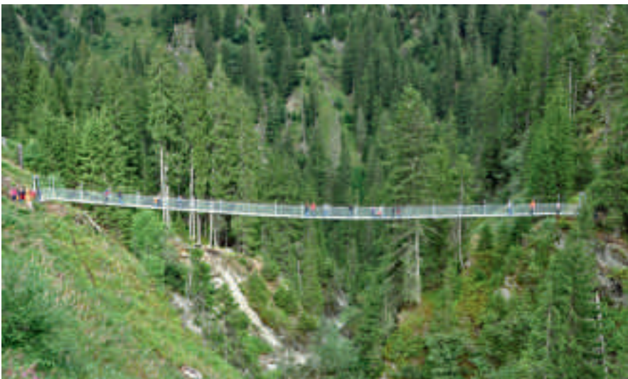
Die 60 Meter lange Hängebrücke wird künftig das Wandern in der Val Sumvitg beträchtlich erleichtern.

Die Reaktionen aus dem Umfeld waren denn auch sehr positiv, und zwei Drittel der Bretter wurden innerhalb kürzester Zeit verkauft. (kra)