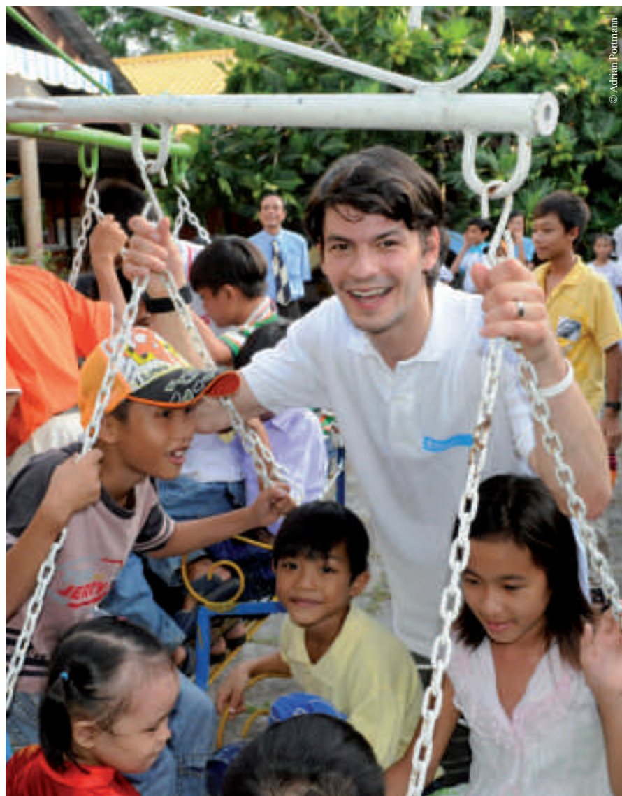
Der Eiskunstlauf-Weltmeister wird im vietnamesischen SOS-Kinderdorf begeistert empfangen.

Die Stimmung im SOS-Kinderdorf beweist dem Eiskunstläufer, dass verlassene Kinder mehr brauchen als nur ein Dach über dem Kopf: «Im SOS-Kinderdorf spüren sie die Geborgenheit und die Liebe einer Familie. Es ist schön, dass diese Liebe auch mir entgegenkommt.» Aus diesem Grund engagiert sich Stéphane Lambiel als neuer Botschafter für SOS-Kinderdorf. Er tut dies, indem er auf die wichtige Arbeit von SOS-Kin-