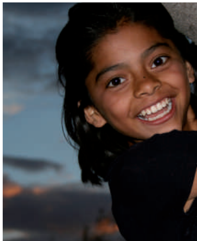
In den SOS-Kinderdörfern erfahren die meist vernachlässigten Kinder,

zum Beispiel, die zweitgrösste Stadt der Welt, wächst wegen der Zuwanderung jährlich um eine Million Menschen.