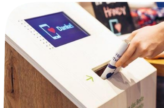
Photo : des boîtes de collecte sont disponibles toute l'année dans des Swisscom Shops partout en Suisse.

anciens téléphones portables ont été collectés en 2025 dans le cadre de l'initiative d'économie circulaire Mobile Aid.