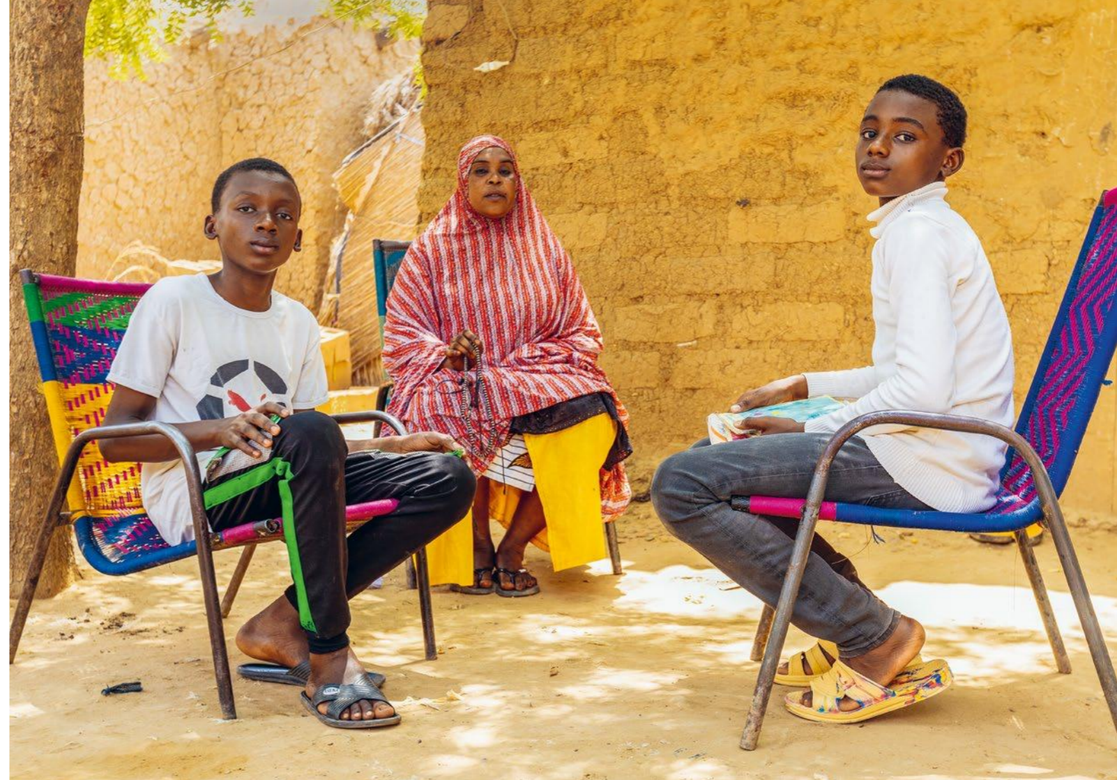
Photo : à Niamey, des familles sont désormais autonomes et prennent soin de leurs enfants.

familles à Niamey sont sorties de la pauvreté et subviennent désormais seules aux besoins de leurs enfants.