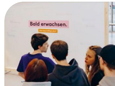
Foto: A Zugo, una classe si è chinata sul proprio futuro.

giovani adulte e adulti sono stati accompagnati o sostenuti nel 2025 tramite INDEPENDA.