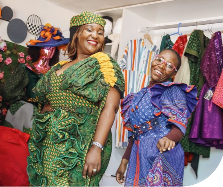
Bild: Nkay und ihre Freundin präsentieren die neusten Designs ihrer Kollektion.

Bild: Langfristiger Frieden ist die Voraussetzung für eine unbeschwernte Kindheit. Hier lächeln Kinder während einer Freizeitaktivität in Gaza.